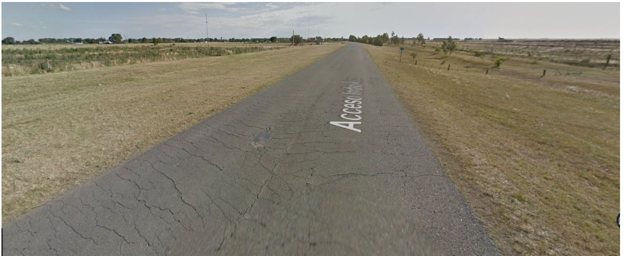
Imagen 4. Deterioro de pavimento flexible en Con. Sec. 023-07, Partido de Cnel. Pringles.