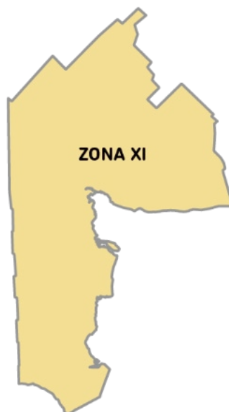
Imagen 2. La Zona XI está conformada por los Partidos: BAHIA BLANCA, CNEL. DORREGO, CNEL. PRINGLES, CNEL. ROSALES, CNEL. SUAREZ, MONTE HERMOSO, PATAGONES, PUAN, SAAVEDRA, TORNQUIST y VILLARINO.