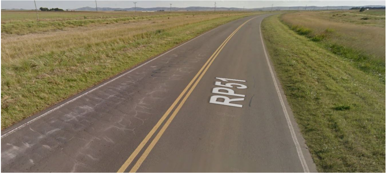
Imagen 3. Deterioro en pavimento flexible en R.P. N° 51, Partido de Cnel. Pringles.